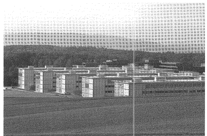
Abb. 4: Synergien durch Forschungseinrichtungen gezielt fördern (Science City, ETH).