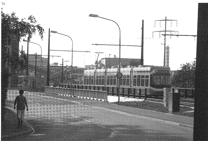
Abb. 3: Infrastrukturen als Schlüssel zur Entwicklung von Räumen nationaler Bedeutung.