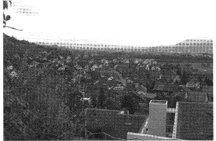
Abb. 2: Das prosperierende Limmattal ist nicht einfach nur «Zwischenstadt».

Dieser Text basiert auf der Studienarbeit «Das Limmattal – ein Raum nationaler Bedeutung. Wissensintensive Einrichtungen in einem übergeordneten Kontext.» im Rahmen des MAS Raumplanung der ETH Zürich. Für die wertvollen Anregungen danken die Autoren Prof. Bernd Scholl sowie Peter Keller. Download unter www.vlp-aspan.ch/de/papers .